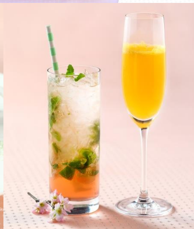
(写真上) 桜アフタヌーンティー