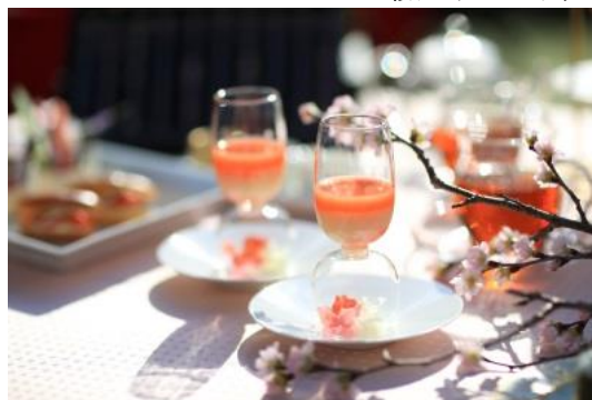
ファーストドリンク