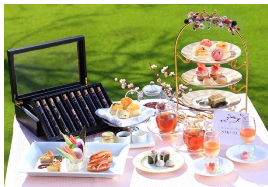
桜アフタヌーンティー