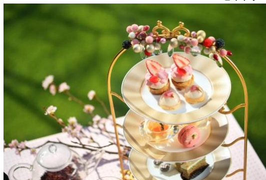
ジュエルスタンド