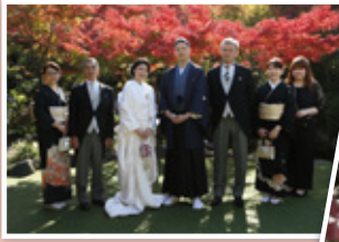
G-sH wI é-³aiNwÁ