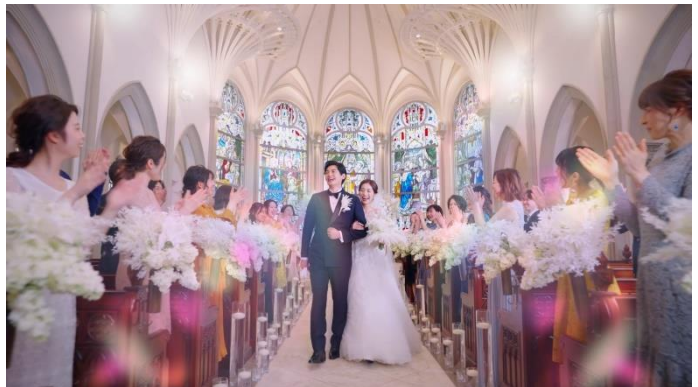
・花嫁ドレス試着