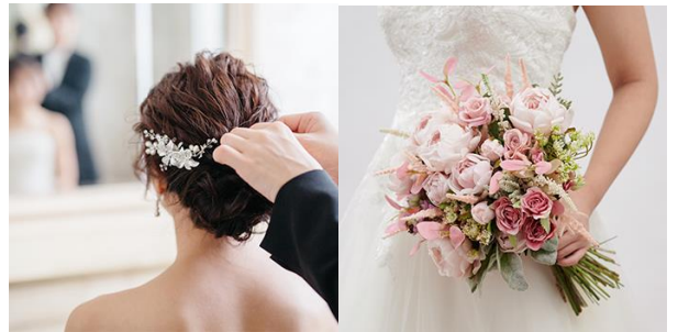
ヘアアレンジ体験