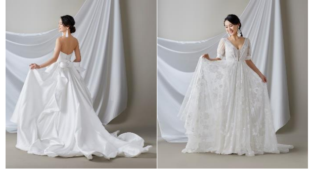
新作ウエディングドレスショー