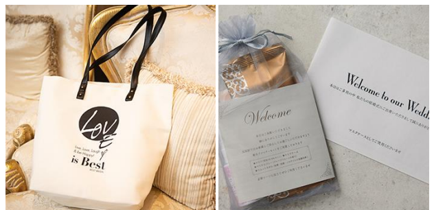
オリジナルエコバッグと衛生アメニティーセットは参加者全組にプレゼント