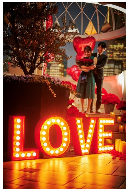
▲ドラマティックローズ 伊勢山ヒルズのチャペルへの設置イメージ

プロポーズは、一生をともに歩む決意を伝える、大切な瞬間。だからこそ、「相手が心から喜ぶことをしてあげたい」「ドラマや映画で観たあのシーンのように、とびきりドラマティックにしたい」「今までに経験したことがないようなサプライズにしたい」。そんな想いを叶える新オプションが誕生いたしました。