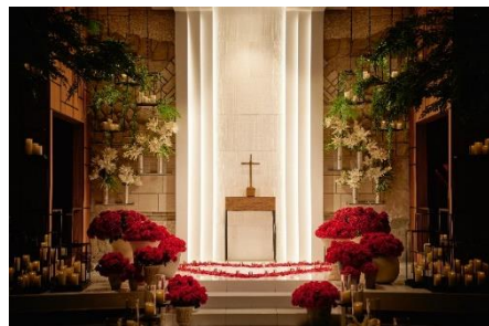
▲大輪のバラに囲まれたドラマティックなプロポーズが叶う。テラスやガゼボなどにも設置可能。