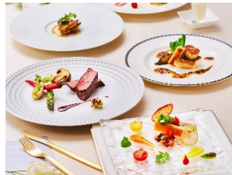
低アレルゲン対応の料理コース