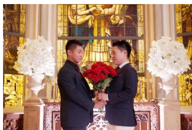
LGBTQ+のお客様の施設利用