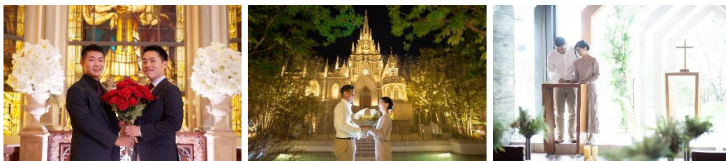
▲ロケーションフォト&チャペルセレモニーイメージ