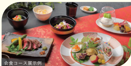
会食コース展示例