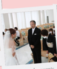
Bride and parents