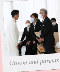
Groom and parents

感謝と感動に溢れた挙式の後は ゲストからの温かい祝福を受け る大階段でのフラワージャワー