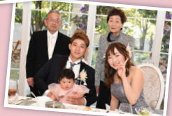
ゲストと一緒に家族ショット