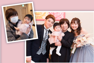
新しい家族の絆 母&娘&孫 ～披露宴後の家族写真タイム～