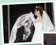
新婦から母へ 願いをこめる ベールダウン

再婚して10周年 結婚式をあげずにbestパートナーとして人生を歩んできた両親へ 自分たちと同じ人生の節目で 両親の10周年をともに祝い 未来の幸せを誓い合って 幸せをもっともっと大きくしてほしい 二人が贈る家族だけの結婚式