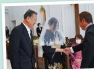
祖父から父へ パトントッチ