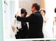
ベールアップ & 誓いのキス