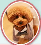
二人のベストパートナー 愛犬「ココちゃん」