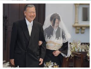
大好きな祖父の エスコート