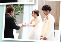
お祝いの プレゼント

何も知らない両親への人生最大のBIGサプライズ 言葉にならない気持ちが涙にあふれる父と母 二人の結婚式で新たな愛が大きく実る 結婚式が結婚式をつなぐ 家族の絆が新しい家族をさらに大きくする