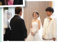
娘から父母へ メッセージ 誓いの言葉