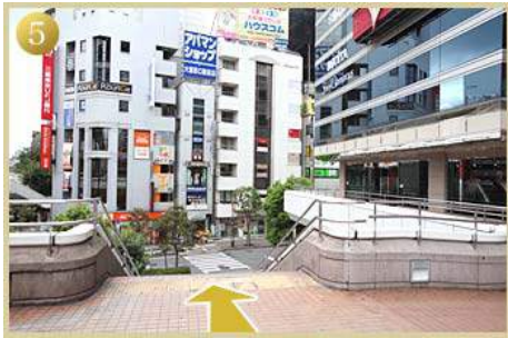
5 この階段を下りる