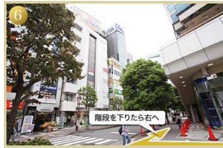
6 階段を下りたら右へ 階段を下り、横断歩道手前を右へ曲がり直進