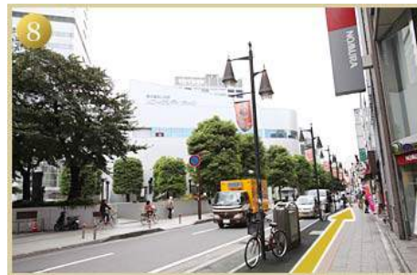
8 ソニックシティホールを左手にそのまま直進