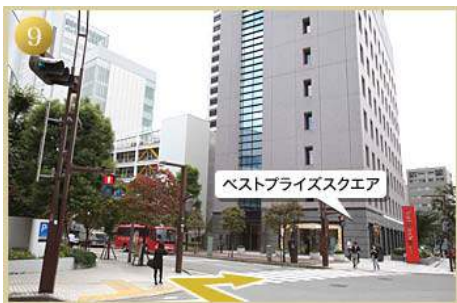
9 最初の交差点のベストプライズスクエアの赤い看板が目印