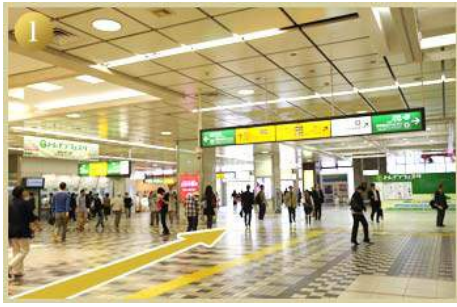
1 JR大宮駅西口を出る(2階歩行者デッキへ出る)