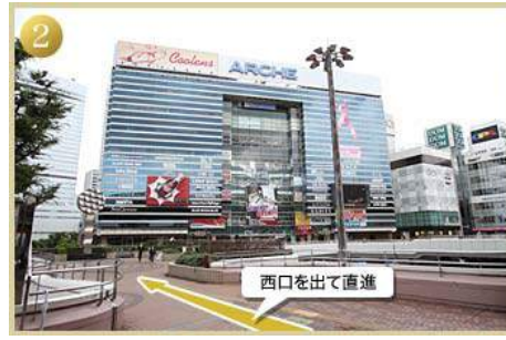
2 西口を出て直進 歩行者デッキに出てアルシェ方向に直進