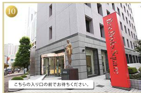
10 建物入り口の前でお待ちください。