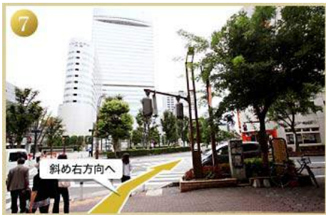
7 一つ目の交差点を斜め右方向へ