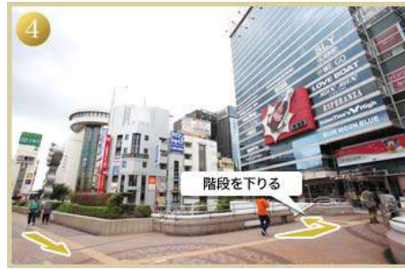
4 階段を下りる 左手の階段を下りる