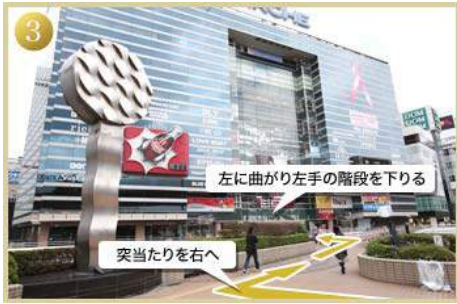
3 突当たりを右へ曲り、次を左へ